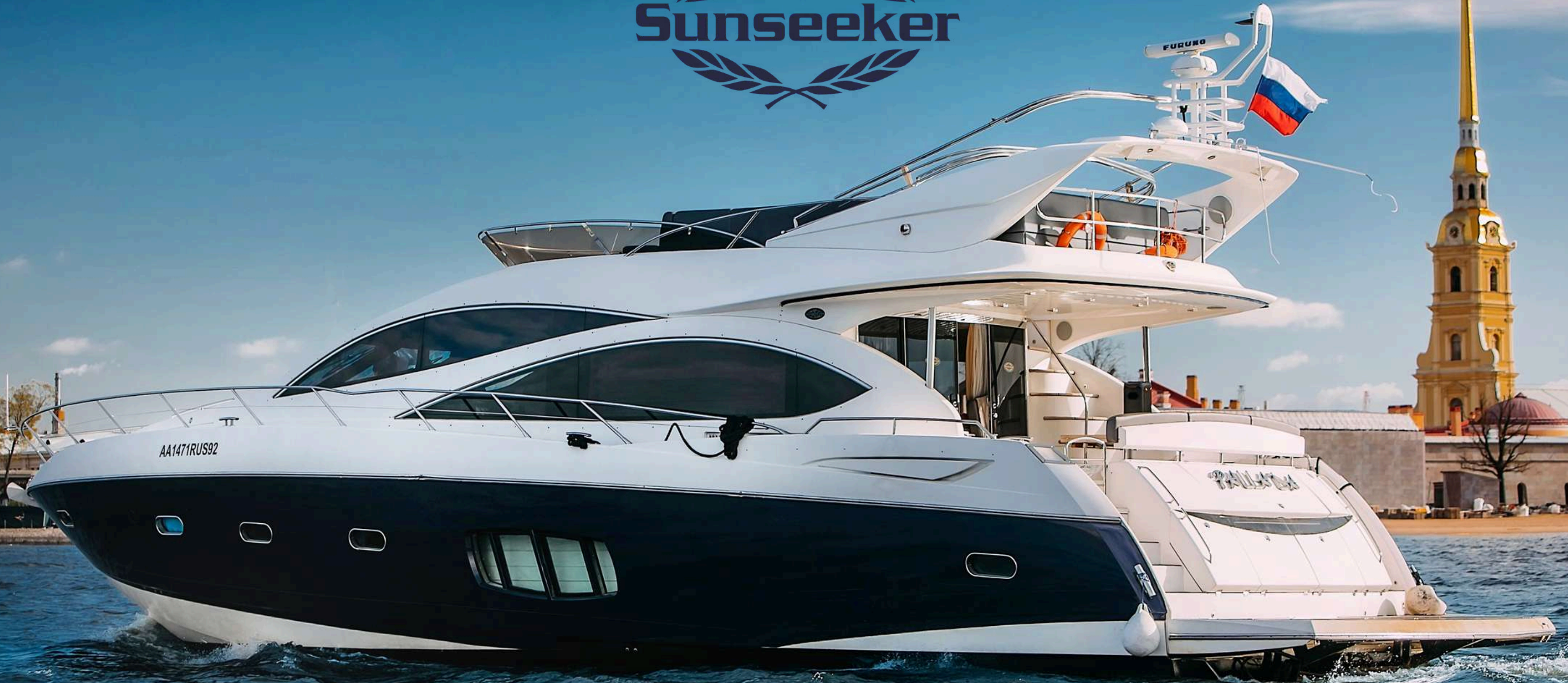
SUNSEEKER PALLADA 70